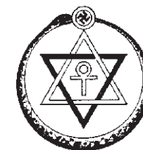
Im Siegel der Theosophischen Gesellschaft finden sich religiöse Symbole verschiedener Kulturen.