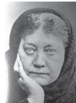
Helena Petrovna Blavatsky (1831-1891) - gründete mit H. S. Olcott 1875 die Theosophische Gesellschaft