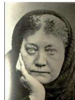
Helena Petrovna Blavatsky (1831-1891) – wraz z H.S. Olcott założyła w 1875 roku Towarzystwo Teozoficzne.